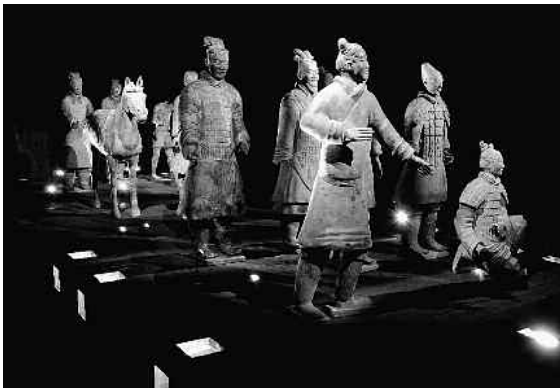
Tentoonstelling Het Terracotta Leger van Xi'an, Drents Museum 2008