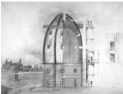
Ontwerp Museum Boymans van Beuningen Aldo Rossi