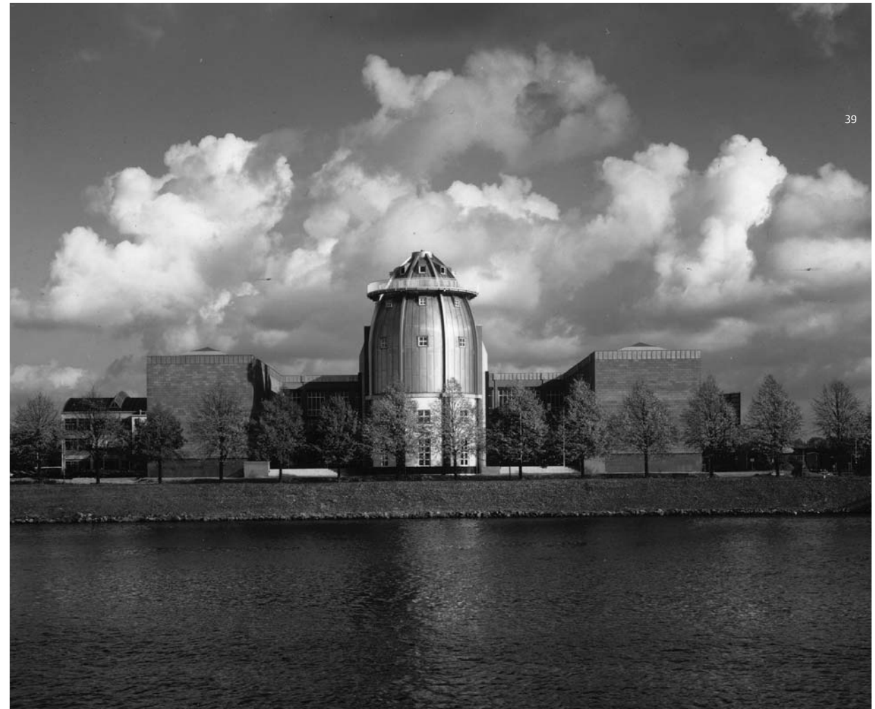
Ontwerp Museum Boymans van Beuningen Aldo Rossi