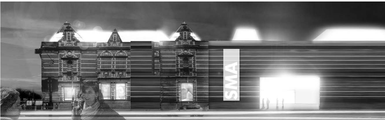
Ontwerp Stedelijk Museum Claus Kaan

Nederland heeft negen modeopleidingen, maar Nederlandse mode is zo goed als nergens te koop en nagenoeg onbekend