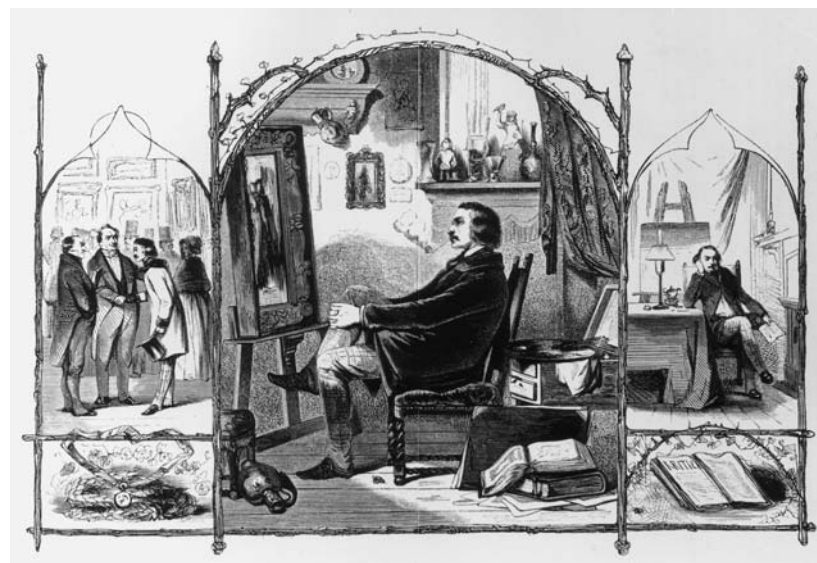
Des schilders mijmering (H.F.C. ten Kate) door J.H. van Hove, 1844-45

Onleesbaar, onduidelijk, gebrek aan diepgang, te theoretisch: deze kwalificaties duiken steeds op in het debat over de kunstkritiek, zo constateert Ton Bevers, hoogleraar aan de Erasmus Universiteit Rotterdam, in zijn internationaal vergelijkende analyse van de stand van zaken in de beeldendekunstkritiek. Bevers'