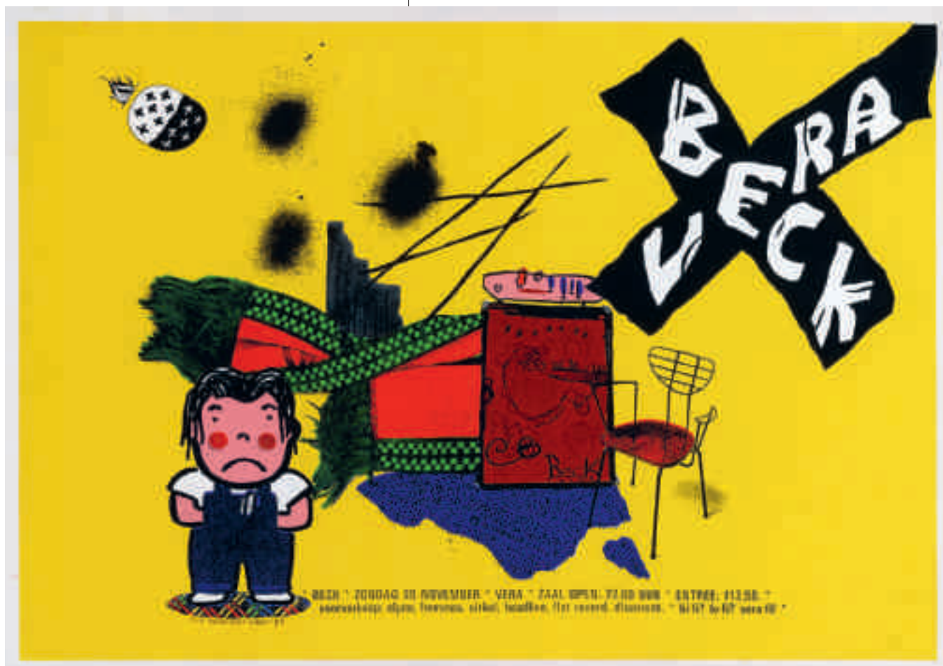
Niek Schutter: affiche concert Beck in Vera, Groningen, 20 november 1994. Collectie Poparchief Groningen

neemt in de loop der jaren af, dus het is zaak om ze zo snel mogelijk te digitaliseren.' Opvallend is dat juist die jaren het best gedocumenteerd zijn, in tegenstelling tot die van het begin van het internet. 'Informatie uit die tijd is nauwelijks meer terug te vinden omdat de sites uit de lucht zijn of onleesbaar zijn geworden. Bovendien zijn gebrande cd's door bitrot of obsoleete bestandsformaten niet meer afleesbaar. Dat is nog een groter probleem dan de cassettes.'