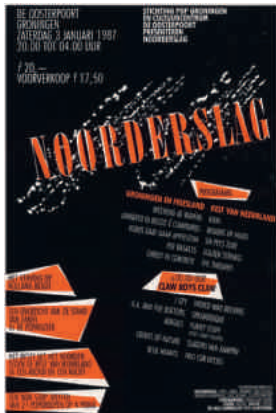
Benne Holwerda: affiche festival Noorderslag in De Oosterpoort, Groningen, 3 januari 1987.