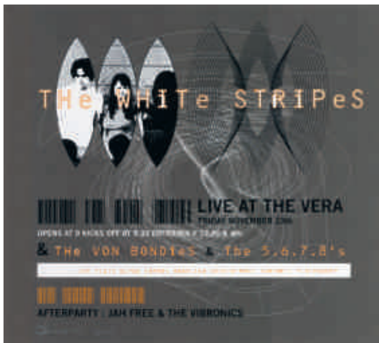
Paul van de Werf: affiche concert The White Stripes in Vera, Groningen, 23 november 2001. Collectie Poparchief Groningen