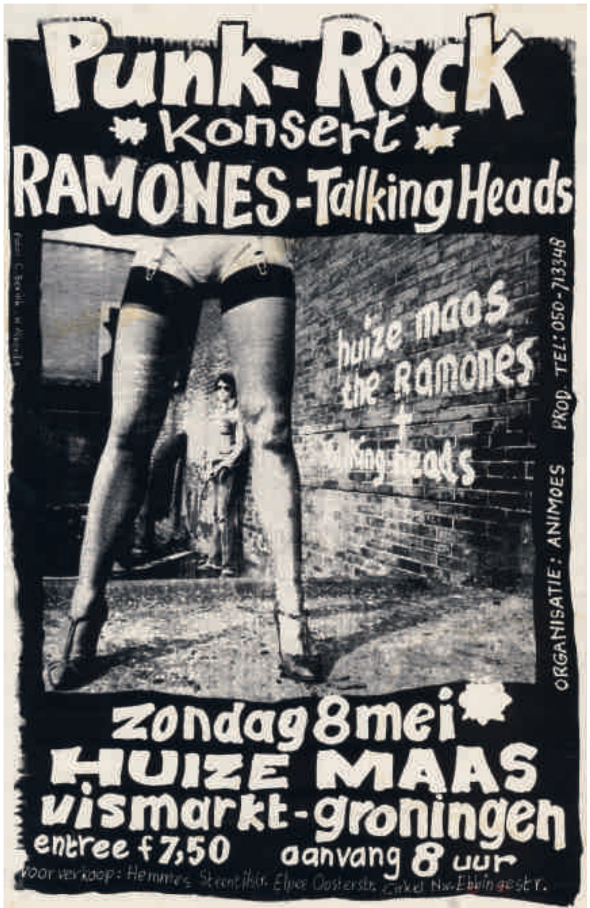
C. Bekink, H. Alberda: affiche concert van Ramones en Talking Heads in Huize Maas, Groningen, 8 mei 1977.