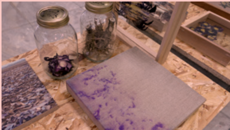
Angelique van der Valk: proces installatie rode kool. © Angelique van der Valk

pigmenten, omdat die minder duurzaam zijn. Daardoor is mijn palet aan kleuren beperkt. Maar dat heeft ook weer zijn eigen esthetische kwaliteit.