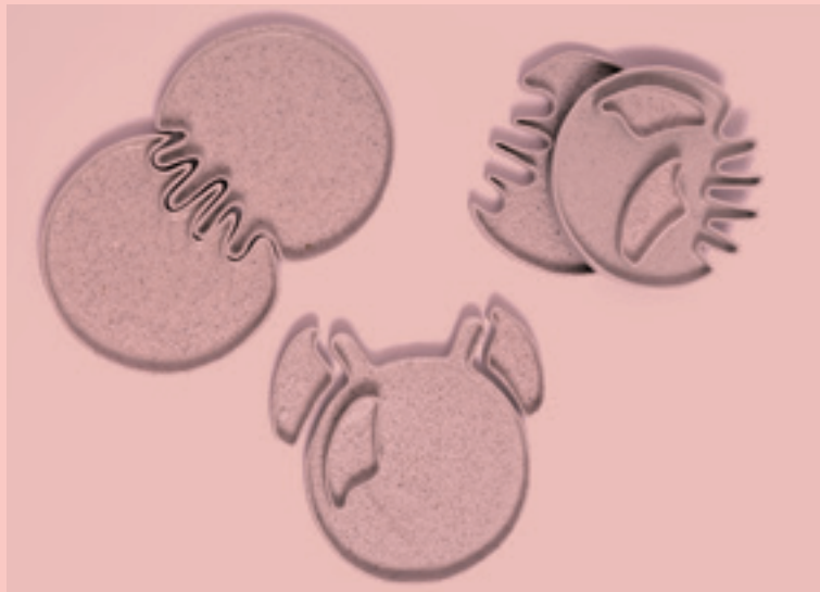
Hanneke de Leeuw: Future history big.

‘Wat ik heel goed zou vinden, is als bedrijven gaan bedenken hoe ze dit toe kunnen passen. Er zijn nu al bedrijven die mij benaderen met de vraag of ik een ontwerp kan maken met hun keramiekafval. Daar werk ik graag aan mee. Het