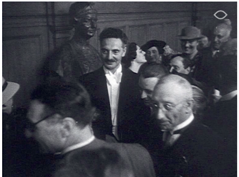
Emanuel Boekman na afloop van zijn promotie, 6 juni 1939, Gemeentelijke Universiteit, Amsterdam. Still uit Cineac-journaal .

In de 19de eeuw was het merendeel van de Nederlandse bevolking amper geschoold, veel mensen leefden in verkrotte en overbevolkte woningen in smerige woonwijken en de landsdelen waren door slechte infrastructuur nauwelijks met elkaar verbonden. In zo'n land kon men ook niet verwachten dat de overheid de kunsten als prioriteit zag. Dat is misschien verklaarbaar, maar het pakte desastreus uit. Door onverschilligheid zijn vele grote kunstwerken verpatst aan particuliere verzamelaars en musea elders in Europa: in onze buurlanden werd daar schamper op gereageerd en werd er vooral van geprofiteerd. Op enkele particuliere initiatieven en legaten na, die nagenoeg niet door de overheden werden (h)erkend, waren kunst en cultuur in het publieke domein destijds feitelijk niet bestaand. Boekman schrijft daarover: 'Dat bij een zoo groote onver-