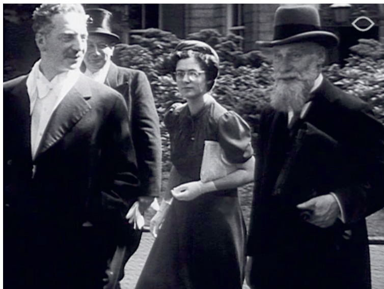
Emanuel Boekman op weg naar zijn promotie, 6 juni 1939, Amsterdam. Still uit Cineac-journaal . Collectie Eye Filmmuseum

Voor deze gelegenheid herlezen ze allen het boek van Boekman. Eén ding mag duidelijk zijn: niet veel proefschriften blijken tachtig jaar na hun verschijning nog altijd zo'n rijke bron van inspiratie te zijn. ●