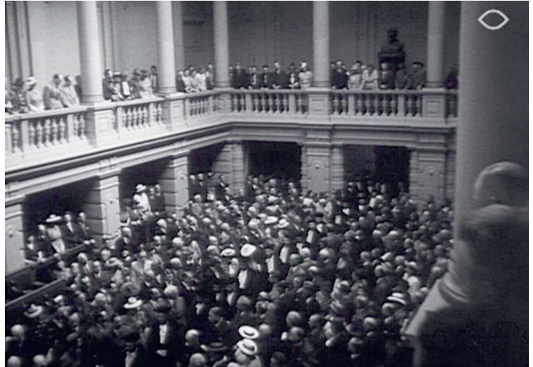
Aula van de Gemeentelijke Universiteit tijdens de promotie van Emanuel Boekman, 6 juni 1939, Amsterdam. Still uit Cineac-journaal . Collectie Eye Film-museum

Boekmans boek zou na de oorlog uitgroeien tot dé klassieker in het denken over cultuurbeleid in Nederland