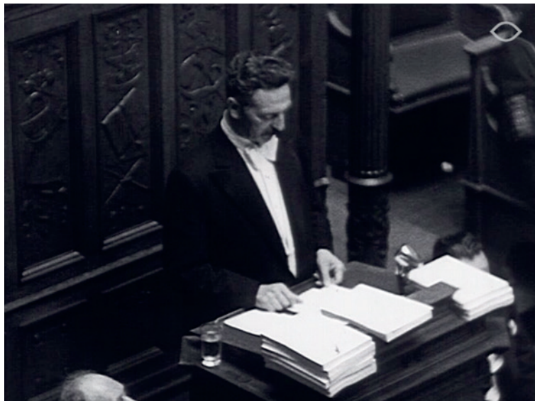
Emanuel Boekman tijdens zijn promotie, 6 juni 1939, Aula van de Gemeentelijke Universiteit, Amsterdam. Still uit Cineac-journaal.

Last but not least is er beweging nodig binnen de gesubsidieerde structuren. Zodat er meer ruimte ontstaat voor genres, verhalen en vertegenwoordigers die recht doen aan de meerstemmigheid van het Nederland van nu. Cultuurpolitiek is ook in dat opzicht bouwen aan een democratisch ideaal. En als er dan toch economie aan te pas komt, graag een fair practice . Want eerlijk loon naar werken is tachtig jaar na Boekmans dissertatie voor heel veel kunstenaars nog steeds geen realiteit. ●