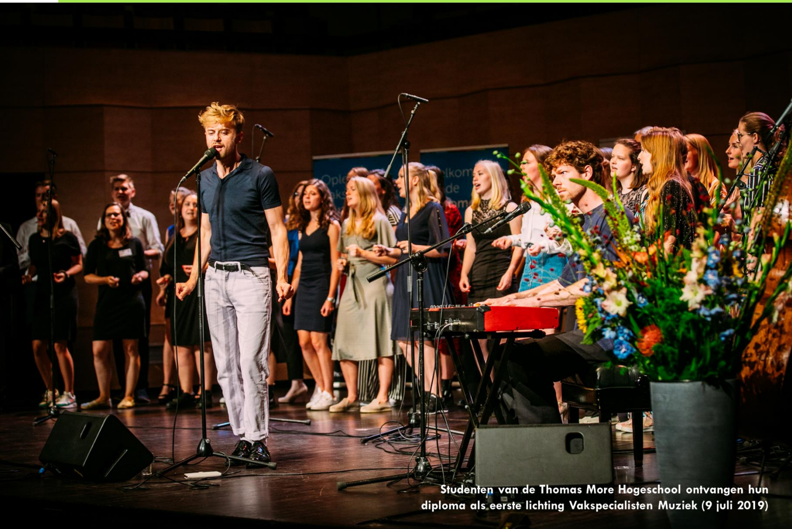
Studenten van de Thomas More Hogeschool ontvangen hun diploma als eerste lichting Vakspecialisten Muziek (9 juli 2019)