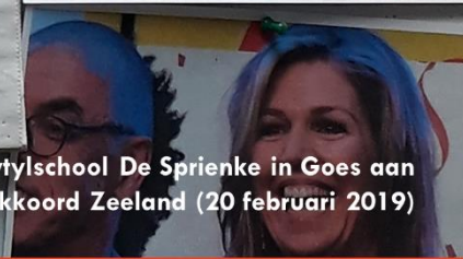
Herinneringen op Mytylschool De Sprienke in Goes aan ondertekening MuziekAkkoord Zeeland (20 februari 2019)