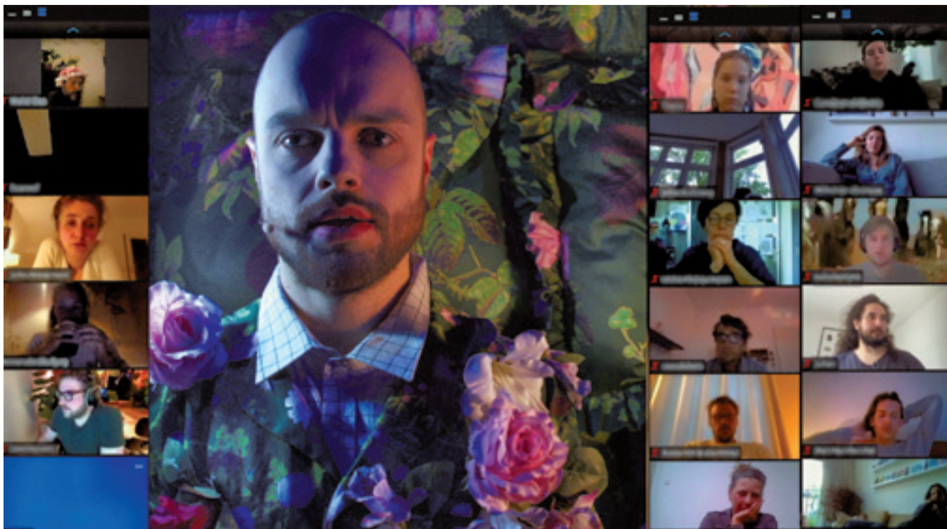
Impressie NITE Hotel op Zoom. Vormgeving: Martijn Halie

Met de noodgedwongen sluiting van onze cultuurhuizen zijn we als sector massaal aan het vernieuwen geslagen. De kunstprogrammering ondergaat een ongekennde digitale transformatie en menig podium of presentatieplek heeft de buitendeuren voorzien van een frisse, glanzende laag. Het grootstedelijk publiek waar we lonkend naar smachten, is in toenemende mate digitaal én divers – en vormt zo twee kanten van dezelfde medaille.