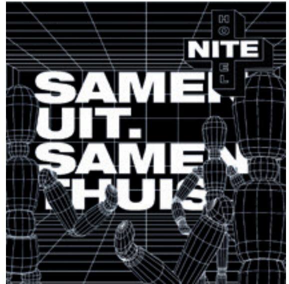
Impressie NITE Hotel. Vormgeving: Martijn Halie

Mijn verwachting is dat instellingen die deze periode niet benutten om zich verder te ontwikkelen op het gebied van diversiteit en inclusie, het de komende beleidsperiode nog lastig(er) krijgen