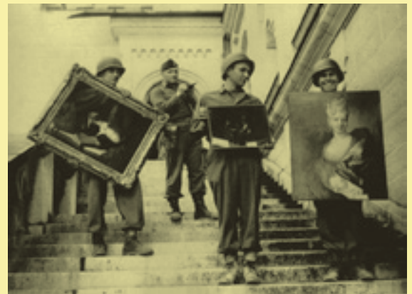
Monumentenofficier James Rorimer bij slot Neuschwanstein, een opslagplaats van de nazi's voor geroofde kunst.