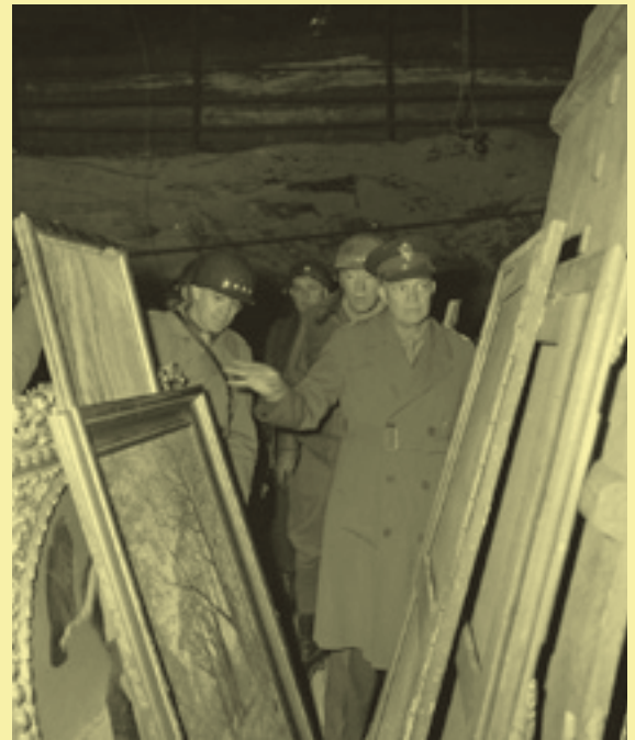
Eisenhower, Bradley en Patton inspecteren op 12 april 1945 schilderijen in de zoutmijn van Merkers.

Natuurlijk is overheidssteun noodzakelijk voor de sector die de hardste klappen moet incasseren in tijden van crisis, maar helaas komt die vooral terecht bij instellingen in de culturele basisinfrastructuur en instellingen en festivals die meerjarig worden ondersteund. Ik maak me vooral zorgen over de kleinere (nieuwe) makers en grassroots makers die geen traditionele band