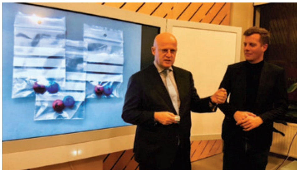
Minister Ferdinand Grapperhaus in gesprek met Tabo Goudswaard over de meerwaarde van het betrekken van creatieven voor taaiere veiligheidsvraagstukken.

Sinds de coronacrisis is duidelijk geworden dat de grote systemen die onze maatschappij draaiende houden op losse schroeven staan. Ze moeten met nieuwe ogen worden bekeken, en daar kunnen creatieve makers een rol bij spelen. Zij zijn vrijdenkers, hebben een frisse blik en oog voor de schoonheid van de samenleving.