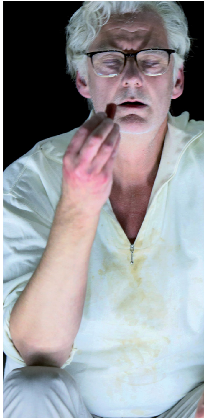
Scene uit The Children , Het Nationale Theater, 2019.

Precies daarin ligt een kans voor de kunst. Waar rapporten en nieuwsberichten vooral met het verstand communiceren, kan kunst ook het gevoel bereiken. Kunst kan ontwrichten en helpen ingesleten denkpatronen te doorbreken die tot de klimaatcrisis hebben geleid. Kunst →