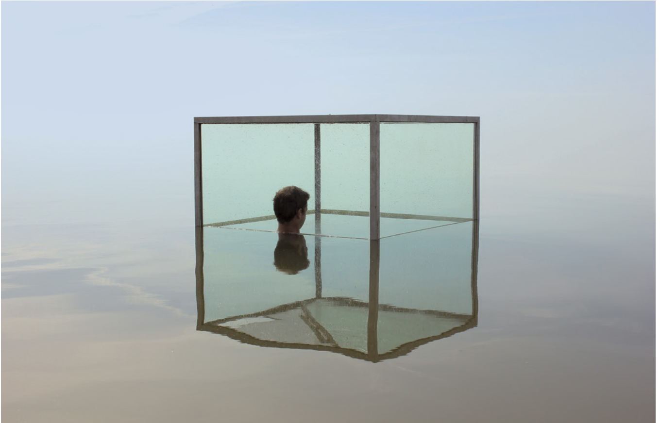
Lotte van den Berg en Daan 't Sas (Building Conversation): We Have Never Been Modern , Oerol, Terschelling, 15 juni 2019.