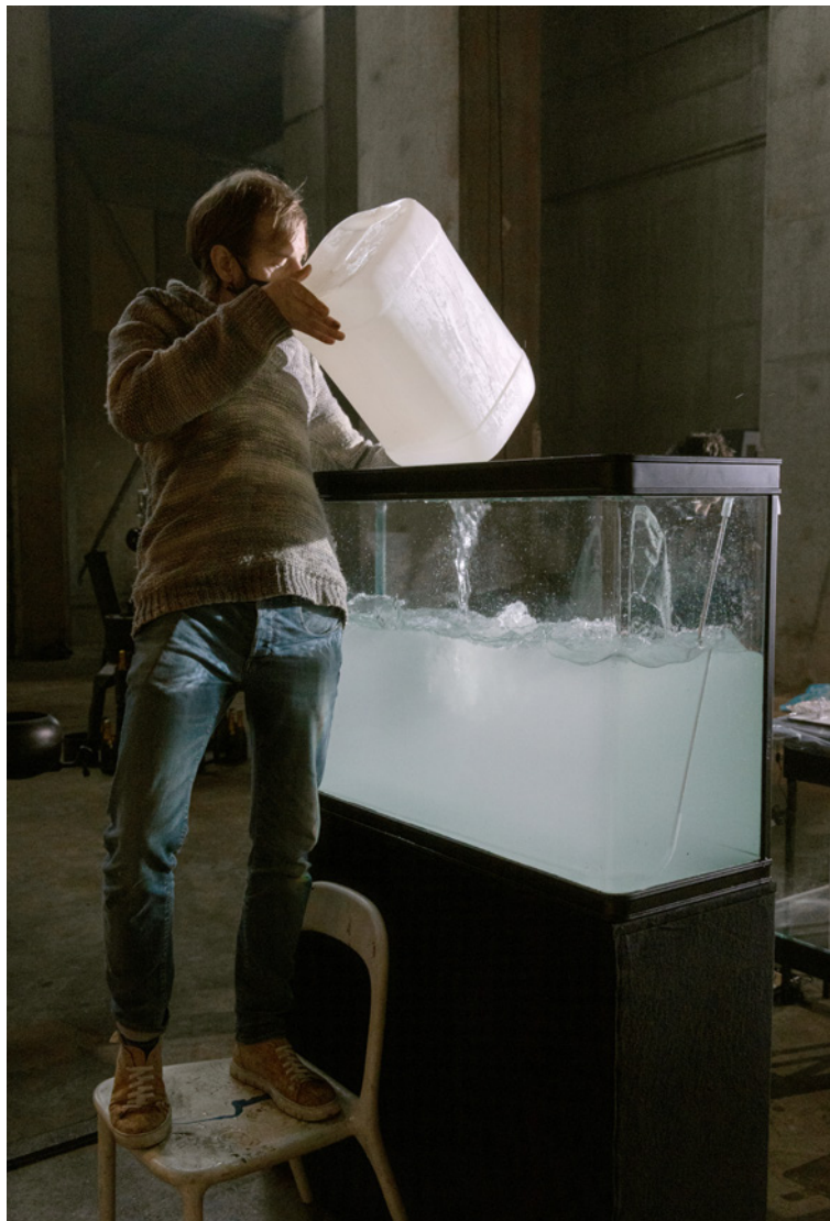
Online-tentoonstelling De afbreek-economie , tot en met 31 december 2021, Museum Boijmans Van Beuningen, Rotterdam.

Waar bovenstaande bronnen vooral ideeën aandragen voor duurzame acties die organisaties, makers en overheden kunnen ondernemen, zijn er ook publicaties die kunnen helpen een