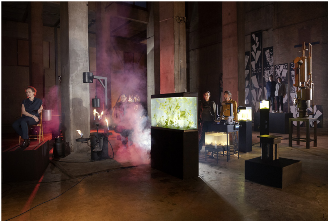
Online-tentoonstelling De afbreek-economie , tot en met 31 december 2021, Museum Boijmans Van Beuningen, Rotterdam.

Aangezien de klimaatcrisis niet ophoudt bij de grens, beperken ook inspirerende initiatieven om deze tegen te gaan zich niet tot Nederland. In het Verenigd Koninkrijk zetten culturele organisaties met ondersteuning van Julie's Bicycle grote stappen op het gebied van duurzaamheid. De Resource Hub op de website van deze organisatie staat vol met webinars, publicaties en podcasts over dit thema. Net als de Boekmanstichting besteden de kennisinstituten voor cultuur en cultuurbeleid in Duitsland en België veel aandacht aan duurzaamheid. Kulturpolitische Gesellschaft wijdde er bijvoorbeeld een themanummer van zijn Kulturpolitische Mitteilungen (Sievers et al. 2019) aan, en het Belgische Kunstenpunt verzamelt publicaties en praktijkvoorbeelden in het dossier ' Duurzaamheid en kunst in transitie '.