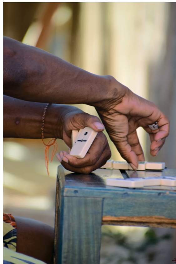
Teatro KadaKen tijdens het Kaya Kaya Straatfeest in 2019.

In de jaren tachtig van de vorige eeuw was op eilandelijk niveau de basis gelegd voor een institutionalisering van cultuur en erfgoed. Deze beleidsterreinen werden een expliciete verantwoordelijkheid van de lokale overheid. Voorheen was deze inspanning nog heel beperkt, mede door de taak die vanuit Nederland was neergelegd bij Sticusa, Stichting voor Culturele Samenwerking tussen Nederland, Indonesië, Suriname en de Nederlandse Antillen, →