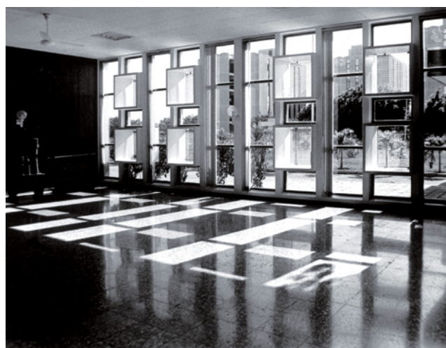
Archieffoto van het interieur van Centro Pro Arte, Curaçao.

Een theater bestieren voor een populatie tussen 2.000 en 160.000 personen is een uitdaging. Van de zes Nederlands Caribische eilanden heeft alleen Aruba een nationaal theater, met een capaciteit van 572 stoelen. Wat zijn de uitdagingen en wat is het belang van een infrastructuur voor de aanwas van theaterbeoefenaars en -liefhebbers op de eilanden?