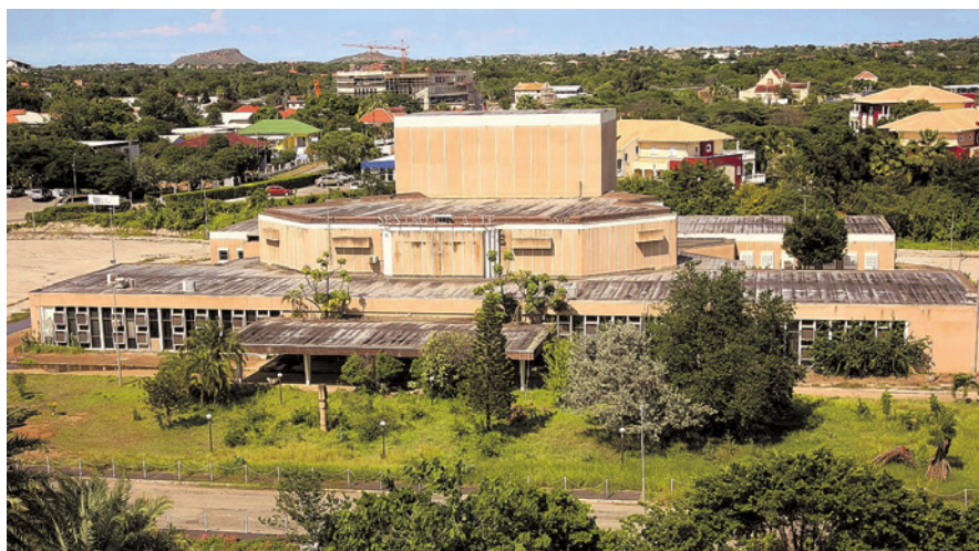
Schouwburg Centro Pro Arte voordat het vlam vatte in 2016, Willemstad, Curaçao.