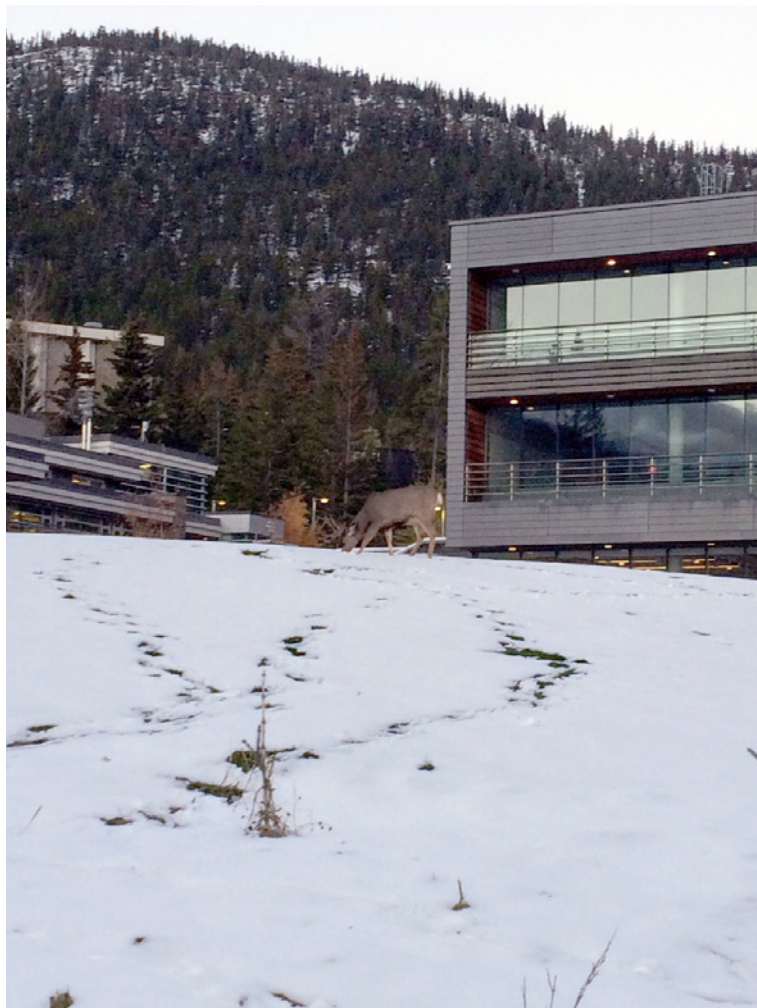
Campus van Banff Centre for Arts and Creativity, Canada.

De Alliance of Artist Communities – een platform dat residentieprogramma's wereldwijd verzamelt, verbindt en ondersteunt – omschrijft