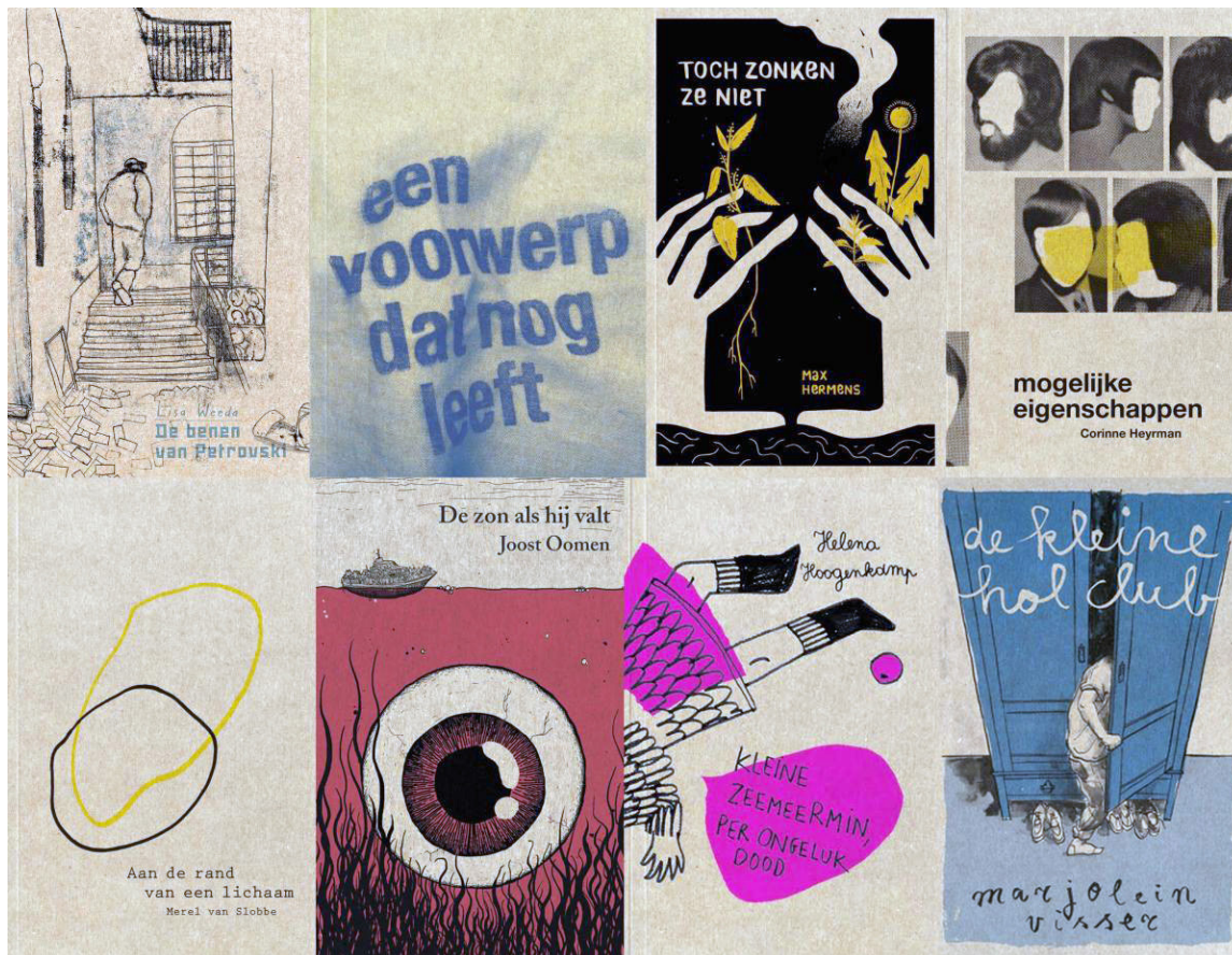
Selectie omslagen van chapbooks , gemaakt met opkomende schrijvers bij De Nieuwe Oost | Wintertuin, als onderdeel van hun talentontwikkelings-traject.

brengen; anderzijds levert de samenwerking en uitwisseling met andere makers en andere disciplines nieuwe vormen, kennis en ideeën op.