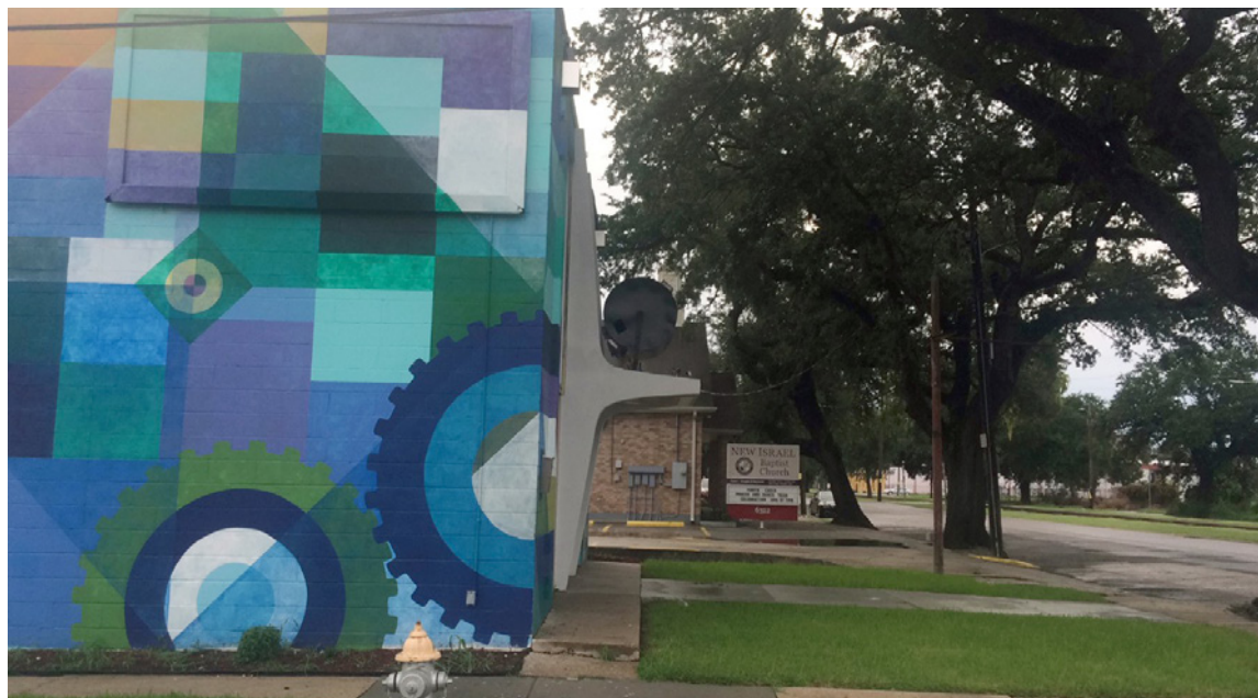
Het print centre Paper Machine van Antenna aan de St. Claude's Avenue in New Orleans.

(een voor beeldende en een voor schrijvende makers) en een print centre genaamd Paper Machine. De organisatie heeft een vestiging aan de rand van de stad, in de Lower Ninth Ward – een van de armste wijken, hard getroffen door de gevolgen van orkaan Katrina in 2005. De plek is opvallend: niet midden in het culturele centrum van de stad, maar juist in een wijk waar het aan cultuurorganisaties en podia ontbreekt. Deze keuze is verbonden met wat toenmalig directeur Bob Snead het belangrijkste vond aan zijn residentieplek: ‘To contrast the clichés of New Orleans, to let people see the nuances – preach the gospel of the city.’ De verbinding met de gemeenschap staat voor Antenna centraal, volgens haar missie is ze ‘a New Orleans-based non-profit organization committed to being a vital participant in the life of a city through the