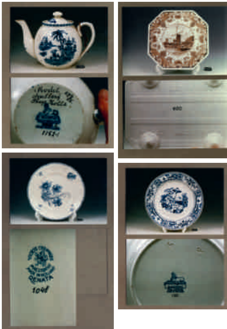
Linksboven/nr. 1152: theepot/aardewerk, decor Honc (jaar onbekend). Petrus Regout/Sphinxcollectie Centre C ramique, Maastricht

Langeweg, S. (2016) 'De techniek van het versieren: het decoreren van aardewerk bij Regout/Sphinx en Soci t  C ramique in Maastricht.' In: Keramiekstad: Maastricht en de aardwerkindustrie in de negentiende en twintigste eeuw , 106-143. (Beschikbaar op: doczz.nl )