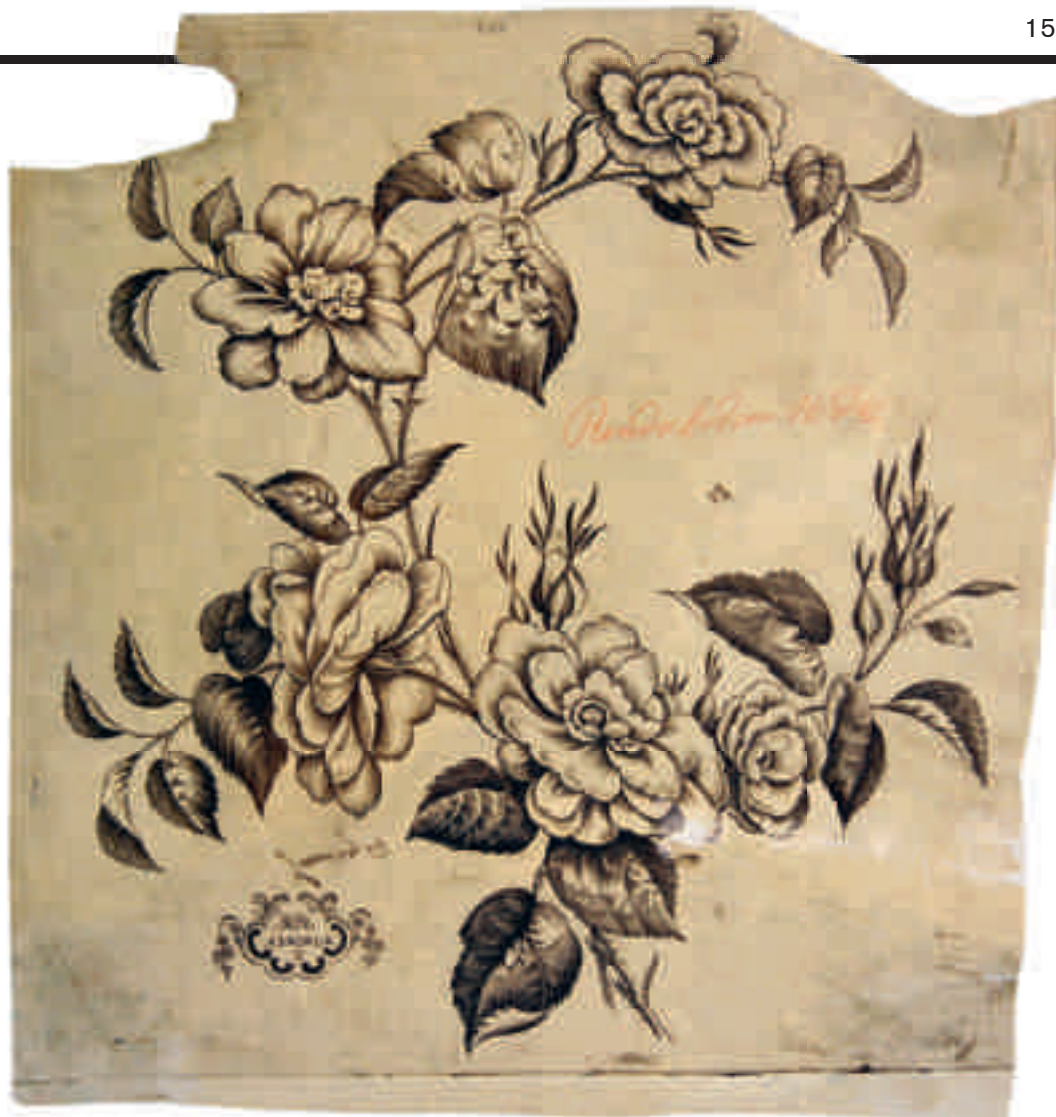
Papieren transfer, decor Aurorea (voor schaal), (1850-1880).

zijn voorlopers, het bedrijf van Petrus Regout dat sinds 1899 De Sphinx heette, en later de Société Céramique die in 1958 met De Sphinx fuseerde.'