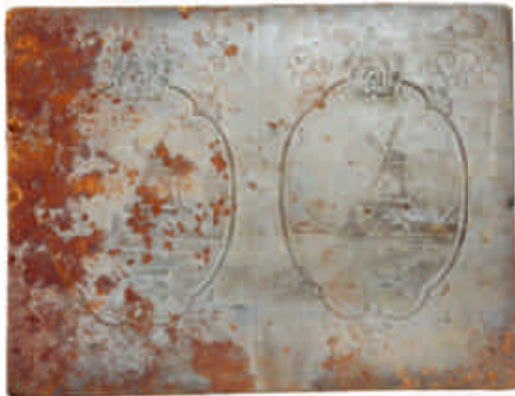
Stalen, verzilverde drukplaat met decor 'Delft-molen', (jaar onbekend). Petrus Regout/Collectie Centre Céramique, Maastricht

'Voor die projecties gebruiken we transfers, of drukdecors, die bewaard zijn gebleven in de archieven van het Sociaal Historisch Centrum voor Limburg', vertelt hij. De term drukdecor verwijst naar een techniek om het aardewerk te bedrukken. Tot ver in de achttiende eeuw werden decors met de hand gepenseeld, maar met transferprinting veranderde dat. Vanaf een gegraveerde koperen plaat werd eerst een afdruk op drukpapier gemaakt. Die afdruk werd vervolgens op een aardewerken voorwerp gelegd, en door met een doekje over het papier te wrijven