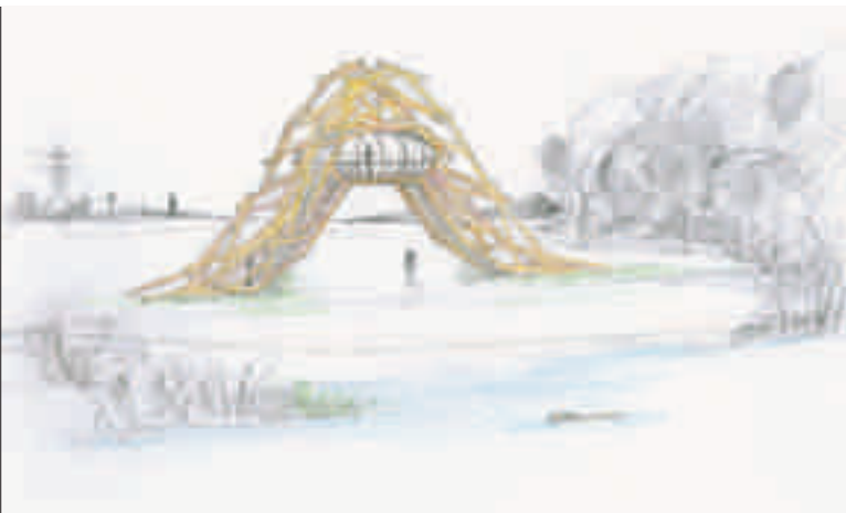
Kunstenaarscollectief Observatorium Rotterdam, ontwerp Beverbrug , natuurgebied de Kleine Zaag, Krimpenerwaard. © Observatorium

De voorstelling Noordwester Wals trok twee seizoenen lang tienduizenden mensen naar een toen nog relatief onbekend gebied in Amsterdam. Het stadsdeel greep zijn kans, en ontwikkelde aansluitend een festival. Het Over 't IJ Festival werd een katalysator voor spontane en informele gebiedsontwikkeling. Er ontstonden in minder dan tien jaar tijd alternatieve horeca, uitvindersclubs, duurzaamheidsinitiatieven,