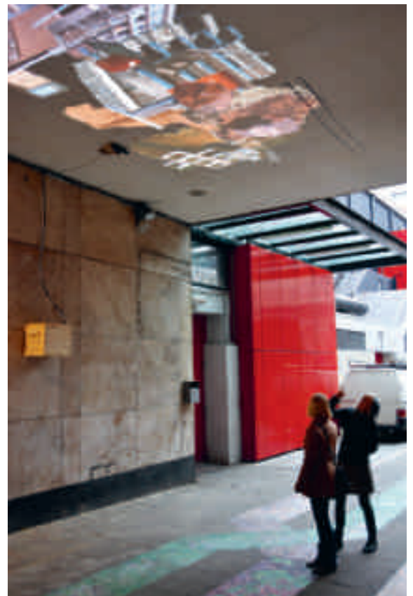
Thijs van Vuure in samenwerking met Rnul interactive, Forward to nature , video-installatie (in opdracht van Architectuurfestival ZigZagCity, Rotterdam), 2012.