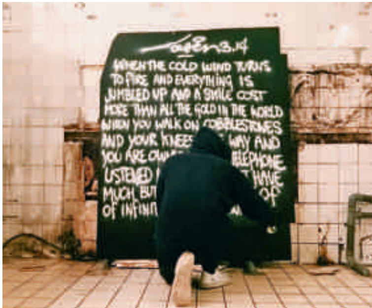
Studio Laser 3.14, Jonge Roelensteeg, Amsterdam, 2015.

Vaak worden bij interventies de mogelijkheden van virtual reality en augmented reality ingezet, om een laag aan de publieke ruimte toe te voegen en nieuwe ervaringen mogelijk te maken. Zoals bij Forward to Nature (2015), een project van Rnul Interactive en bioloog en theatermaker Thijs van Vuure. Zij creëerden een virtuele, interactieve natuurbeleving in de stad waarbij de voorbijganger een natuurlijke setting naar keuze kan laten projecteren over de architectuur van de steeg waar hij doorheen loopt. 4 Het kunstwerk als interventie wordt geen onderdeel van de inrichting van de publieke