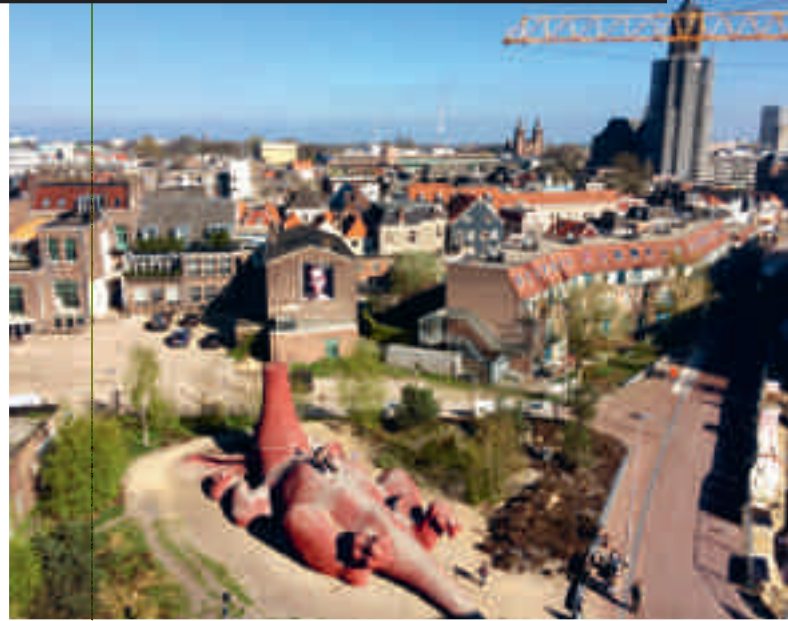
Feestaardvarken in het Bartokpark, Arnhem.

Openbare ruimte is essentieel voor het functioneren van steden. Vanuit dat perspectief is de Nederlandse overheid al decennia-lang hoeder van die openbare ruimte. Maar tegenwoordig zijn er steeds meer nieuwe opdrachtgevers bij betrokken, van marktpartijen tot burgerinitiatieven. Wat betekent dit voor het binaire onderscheid publiek versus privaat?