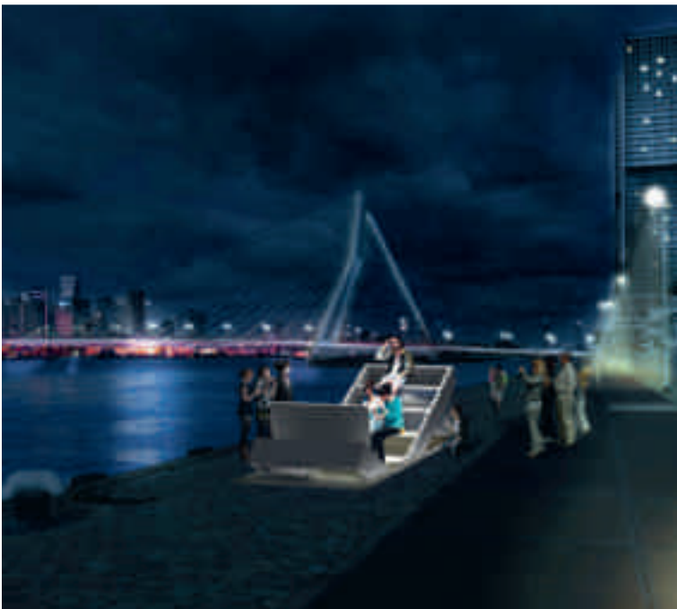
Visuals van de walstroomkelder, Wilhelminapier, Rotterdam. © TomDavid Architecten