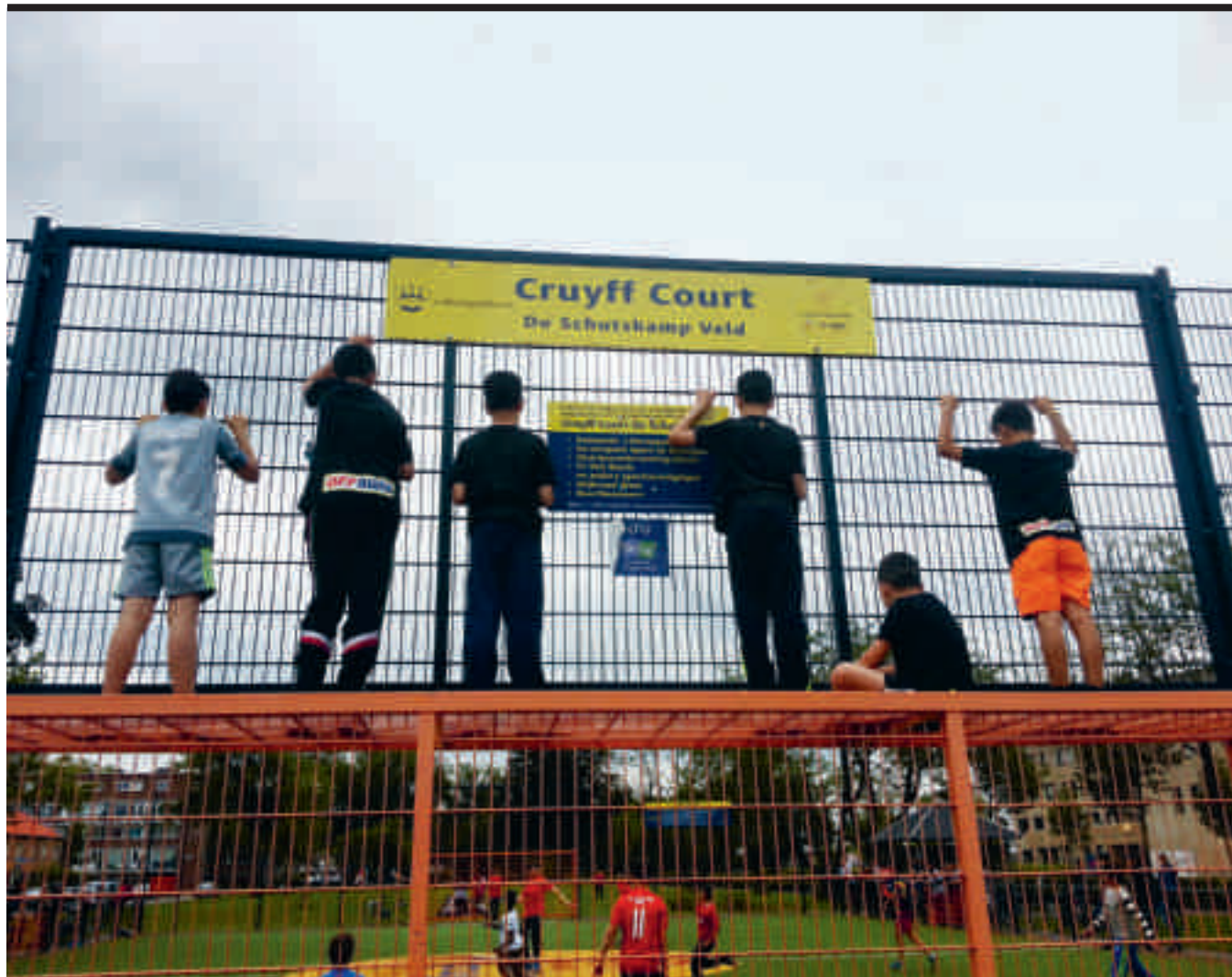
Doelbewust, 's-Hertogenbosch.