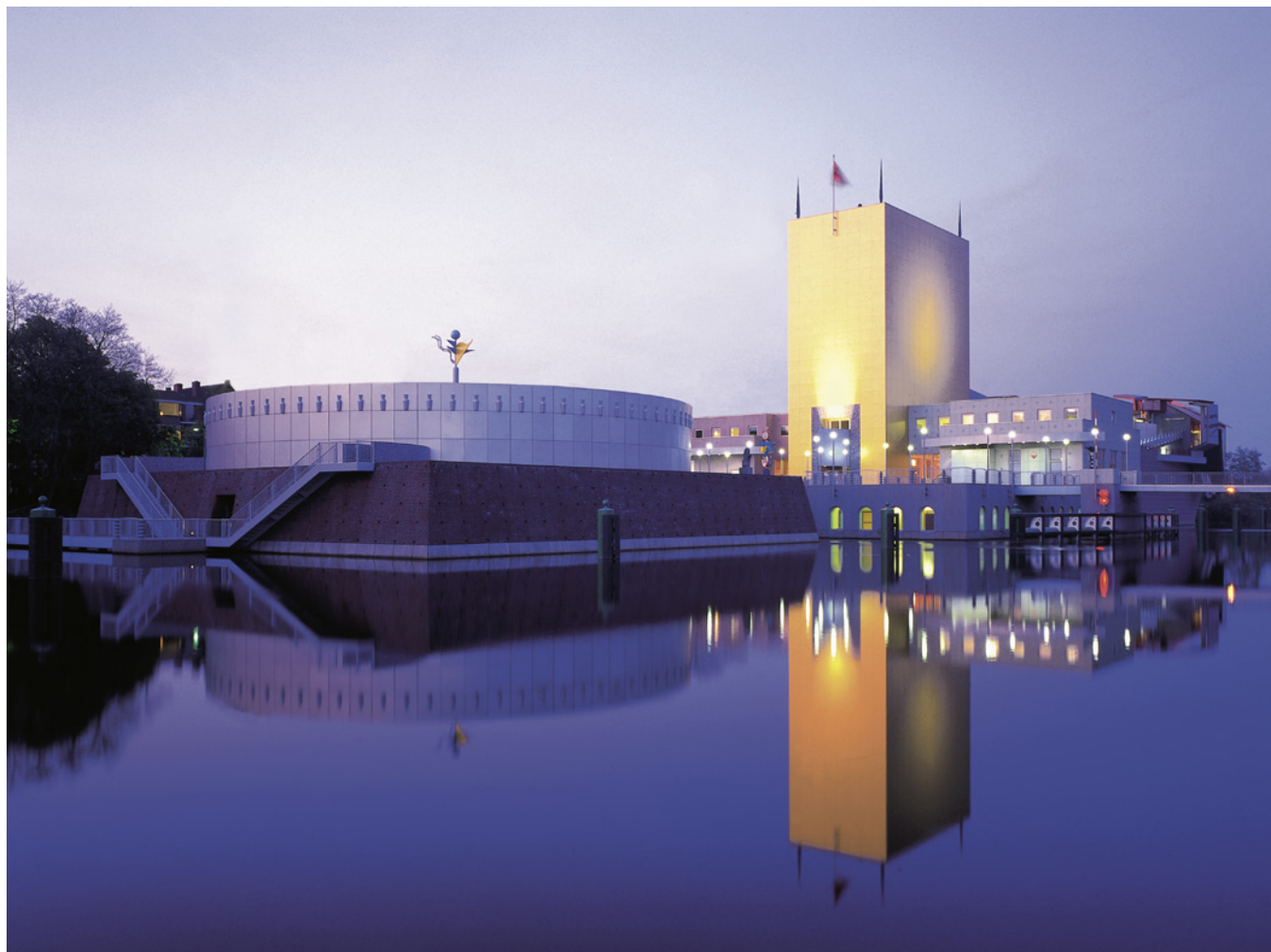
Groninger Museum, Groningen.

kadernota naar acht jaar, verminderen het aantal ambities en strategieën en bieden een aantal instellingen zicht op een achtjarige subsidie. Dit vermindert bureaucratie en regeldruk. De instellingen moeten wel na vier jaar een update van hun beleidsplan indienen bij de kunstraad met het oog op samenhang binnen het beleid en de inzet van de middelen. Hun functie verplicht hen een goed voorbeeld te zijn van artistieke kwaliteit, samenwerking, goede bedrijfsvoering en het stimuleren van de zichtbaarheid van kunst en cultuur in de gemeente', zo staat te lezen in het cultuurplan 2021-2024 (Rook 2019, 15-16).