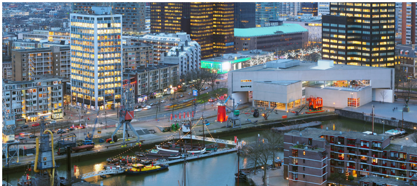
Museumhaven, Maritiem Museum Rotterdam.

te verlengen tot zes jaar, zodat de cultuursector kan herstellen van de coronatijd en hierover in gesprek kan gaan met het Rijk (Ibid., 3)