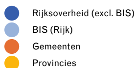
Figuur 1. Verdeling overheidsuitgaven cultuur, 2019 (in procenten) Bron: CBS en ministerie van OCW

en de voor- en nadelen. De belangrijkste overeenkomst tussen de varianten is dat er, wat de onderzoekers noemen, een 'knip' wordt gemaakt tussen instellingen die wel en instellingen die geen deel uitmaken van de culturele basis. 'De culturele basisinfrastructuur is het fundament van kunst en cultuur in de stad. Alle varianten willen een stabiele basis van instellingen realiseren waarbij deze instellingen verantwoordelijkheden krijgen én nemen.' (Modderman et al. 2019b, 7) Het belangrijkste verschil tussen de varianten is het vertrekpunt: draait het in de basis om instellingen die een sleutelpositie vervullen, of dient de basis een zo breed en representatief mogelijke vertegenwoordiging van culturele instellingen te zijn, bijvoorbeeld op grond van geografie, sector en omvang? Oftewel, worden instellingen geselecteerd 'op naam' of 'op functie'? Een culturele basis 'op naam' kan tot een onevenwichtige culturele basis leiden, waarschuwen de rapporteurs, omdat niet alle disciplines vertegenwoordigd zijn en omdat er geen representatieve culturele basis ontstaat, bijvoorbeeld qua inwoners en spreiding over de stad (Ibid., 10)). Voordeel van het inrichten 'op functie' is volgens de rapporteurs dat de culturele basis als geheel wordt ingevuld, waarbij er bijvoorbeeld geborgd kan worden dat alle disciplines zijn vertegenwoordigd en er ook ruimte is voor bijvoorbeeld dynamiek en experiment.