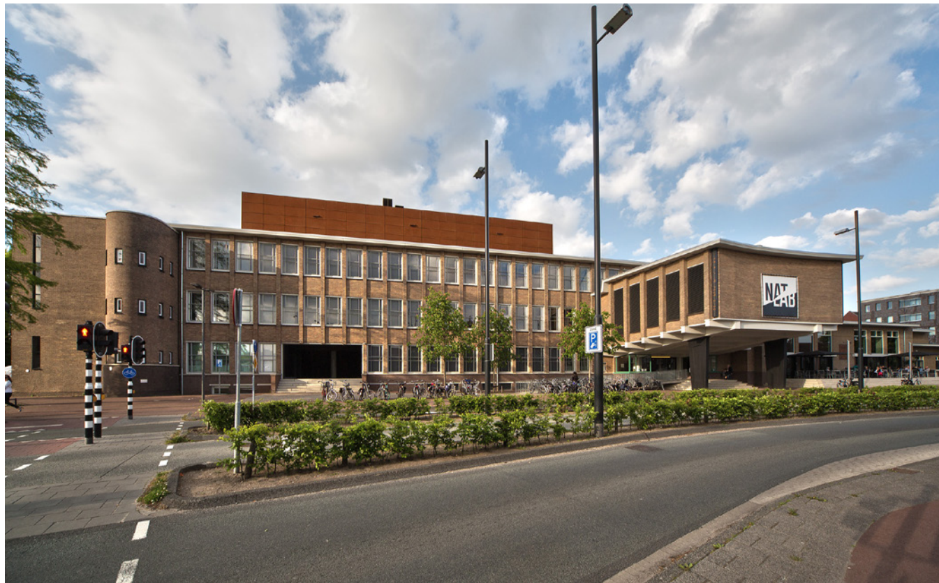
Natlab, Eindhoven.

Cultuurbrief met daarin het cultuurbeleid in hoofdlijnen (Mlaker 2016). Stichting Cultuur Eindhoven wordt hiermee het eerste gemeentelijke fonds dat het volledige stedelijke cultuurbeleid uitvoert, op afstand van het gemeentelijk apparaat (Nuchelmans 2016).