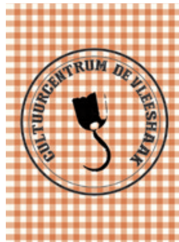
Links: Repetitieplanning van CC De Vleeshaak. Boven: Logo van CC De Vleeshaak. Ontwerp: Dominique Vilain

gevoerd met topinstellingen en -gezelschappen uit de podiumkunsten om van De Vleeshaak hun try-outplek te maken en er is zelfs sprake van uitwisseling met – jawel – Centre Pompidou. Bovendien, zo vervolgde de directeur enthousiast, wordt het cultureel centrum het ‘uithangbord’ van een algehele aanstaande renaissance van de Dam, met meer jobs, meer groen, betere luchtkwaliteit, betere woningen en betere mensen. ‘Den Dam, een buurt die steeds achteraan bungelde, wordt nu een prioritair project en ik ben er zeer trots op dat wij dit gaan realiseren!’ Na een lauw applaus komen de eerste kritische vragen uit het publiek, waarvan een deel niet wist dat het fictie betrof en een deel dat even was vergeten. Wie gaat De Vleeshaak eigenlijk bedienen? Als de directeur zegt dat het een plek wordt voor de buurtbewoners, over wie spreekt hij dan: de mensen die hier nu wonen, of de meer kapitaalkrachtige nieuwe buurtbewoners die het hoopt aan te trekken?