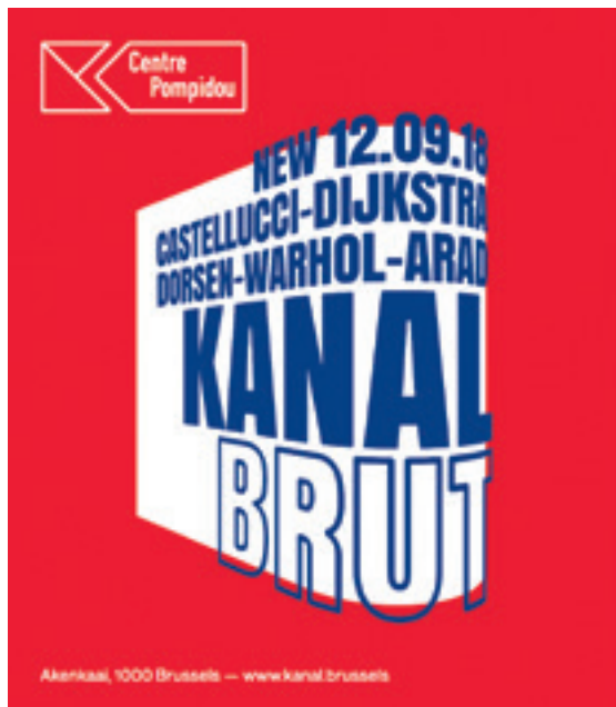
Advertentie voor een tentoonstelling in Centre Pompidou-filiaal KANAL, Brussel