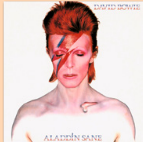
David Bowie, Aladdin Sane , 1973

Niet alleen vervaagt de grens tussen werk en vrije tijd, ook krijg je op festivals en concerten, in kleedkamers en perstent, tijdens netwerkborrels, maar ook bij conferenties en in je favoriete platenzaak al snel een biertje in je handen gedrukt. Het is makkelijk om nu te roepen dat iedereen hierbij zijn eigen grenzen aan moet