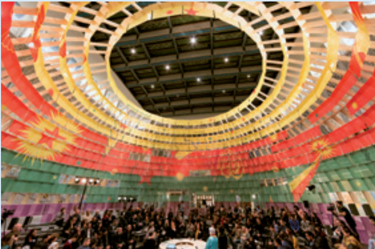
New World Embassy: Rojava, Democratische Zelf-Administratie van Rojava en Studio Jonas Staal, 2016. Fotografie: Istvan Virag, Architectuurbiënnale Oslo

moeten opereren: kunst heeft een rol in het sterken van progressieve politieke partijen in het parlement, maar ook van sociale bewegingen op straat.