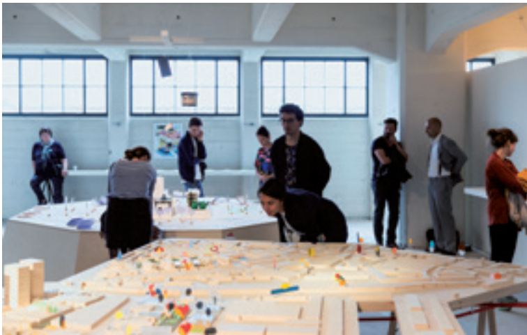
Openingsweekend van de Internationale Architectuur Biënnale Rotterdam, 2018.

In de uitgangspuntenbrief voor het cultuurstelsel 2021-2024 legt minister Van Engelshoven een grote ambitie neer met betrekking tot vernieuwing en verbreding. De culturele basisinfrastructuur wordt daarom onder andere uitgebreid met vijftien ontwerp- en ontwikkelinstellingen die interdisciplinair werken (Engelshoven 2019). Mooi nieuws voor de creatieve industrie. Maar het zal een lastige kluit worden om binnen die brede categorie de zeer verschillende instellingen onderling te vergelijken. Hoe kunnen de instellingen die het Stimuleringsfonds Creatieve Industrie momenteel bedient, aan de doelen van dat nieuwe cultuurstelsel bijdragen?