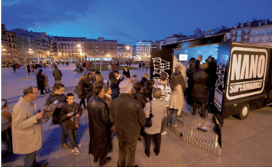
NANO supermarket in Pamplona, 2011.

Het streven is om met deze vier kwadranten 6 tot een indeling te komen op basis van de primaire focus van de ondersteunde instellingen in de creatieve industrie. Daar zitten los van de hier gebruikte assen natuurlijk nog meer dimensies aan. Evenzeer geldt dat instellingen zich operationeel vaak in meerdere kwadranten begeven.