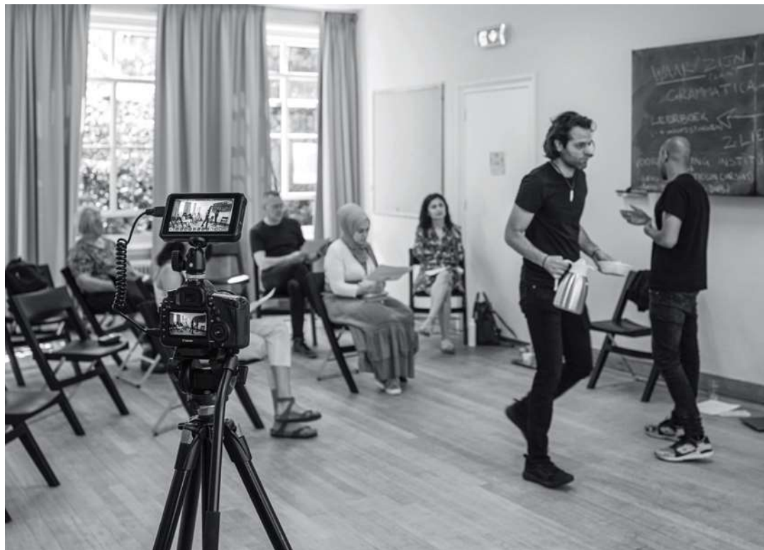
Meeting van het Pidgin Instituut Groningen, Noorderzon, Groningen.