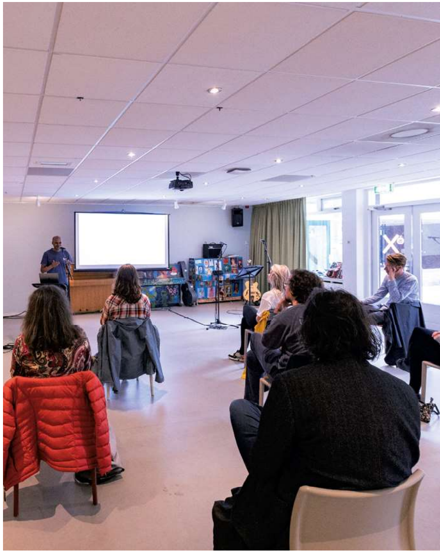
Presentatie van het Pidgin Instituut Groningen, Noorderzon, Groningen, 17 augustus 2021.

andere overheden willen uitdagen om een nieuwe proeftuin aan te leggen. Een waarin de politieke civiele waarde van kunst tot wasdom kan komen door de verbeelding toe te laten in het publieke en politieke debat. Door dit soort projecten niet alleen te presenteren op een kunstenfestival, maar ook op publieke plekken buiten de culturele sector. Door politici en ambtenaren van andere beleidsterreinen uit te nodigen en door gesprekken met de makers en het ‘publiek’ aan te gaan. En door makers en culturele organisaties te faciliteren buiten de kaders van de culturele sector werk te maken en te tonen dat dit in directe relatie staat met die sociale context. Kortom: door cultuurbeleid breder te trekken dan de kunst en cultuur die wij gewend zijn te beleven, en de manier waarop we dat doen. •