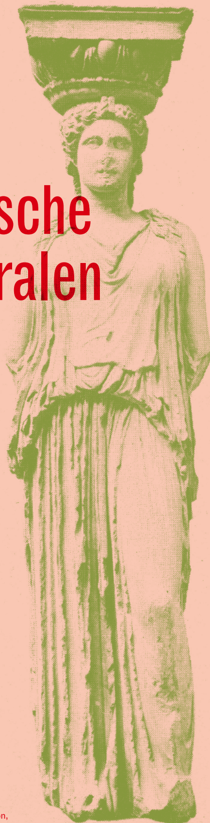
Kariatide van het Erechtheion, Athene

Ik haalde zoonlief weer eens op van school en daar waar hij het telkens weer voor elkaar kreeg om overdreven vrolijk en fluitend de bekende route naar huis af te leggen, had ik mij na driehonderd meter al zes keer boos gemaakt. Mijn geduld werd namelijk dagelijks op de proef gesteld door zijn gewoonte om tergend langzaam te lopen. En wanneer ik hem vroeg waarom hij zo traag was, antwoordde hij steevast: 'Papa, dat komt omdat ik nadenk terwijl ik loop.'