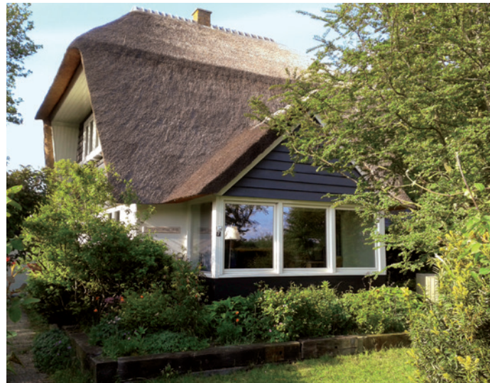
Het Roland Holst-huis, Bergen, Noord-Holland.

← Bericht van Pieter Hoexum in het gastenboek van het Roland Holst-huis, 2017.