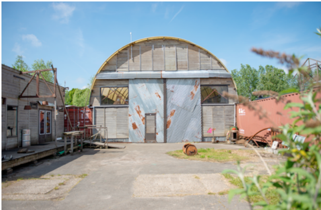
Terrein van Broedplaats de Campagne, Groningen.