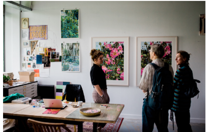
Kunstenaar en bezoekers in een atelier tijdens een open dag in de Biotoop, Haren

vanuit verschillende beleidsdisciplines (cultuur, stadsontwikkeling, vastgoed, economie). De belangrijkste uitgangspunten zijn: voldoende en betaalbare ruimte, ruimte voor innovatie en vernieuwing, en het ondersteunen van talent en ondernemerschap. Doel van Aanpak broedplaatsen is om de creatieve sector tot bloei te laten komen en daarmee bij te dragen aan Groningen als creatieve stad en City of Talent. De gemeente wil daarom de kwaliteit en kwantiteit van creatieve werkplekken borgen en broedplaatsen de ruimte geven om zich verder te ontwikkelen.