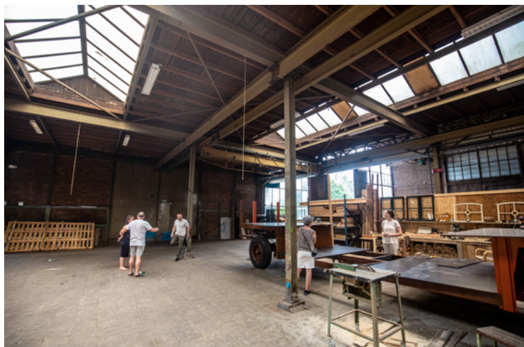
Open Sluis Weekend in de Sluisfabriek, Drachten, augustus 2020.

In het nieuwe cultuurplan zet de gemeente deze ambitie voort. Makers zijn net als culturele organisaties en ondersteuningsinstellingen, talentontwikkeling en publiek allemaal nodig voor een sterke culturele sector. ‘Ingebied in een ecosysteem zijn makers van grote waarde voor de (ontwikkeling van de) stad en voor de toekomst. Ze dragen bij aan de leefbaarheid van de stad en verbeelden de stad van morgen en van de toekomst’. In het beleidsplan worden ateliers en broedplaatsen ‘de culturele kraamkamers, plekken van uitwisseling en ontmoeting’ genoemd. Ze zijn van levensbelang ‘(...), bijvoorbeeld om jonge (recent afgestudeerde) makers aan de stad te binden of, van elders, naar de stad te lokken.’