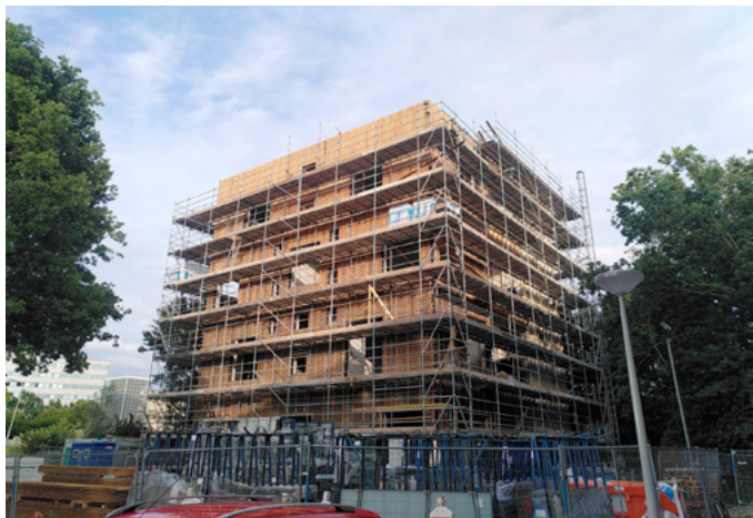
Het Nieuwe Bajesdorp in aanbouw, Amsterdam, september 2023.