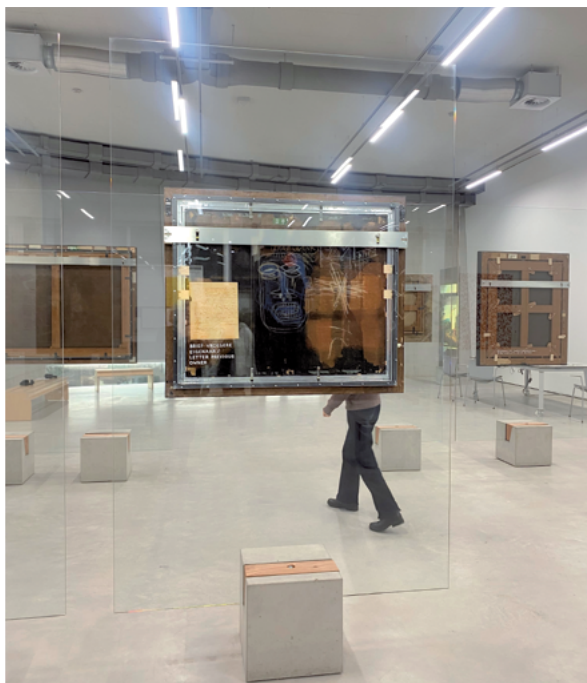
Brief van D.G. van Beuningen op achterzijde schilderij, Depot Boijmans Van Beuningen, Rotterdam, 2024.

W ie maalt er nou om kunst, zei laatst iemand. Iemand uit de kunstwereld. En hij ging, uitdagend, verder: niemand zal een traan laten als er geen kunst meer is. Maar wie of wat daagde hij nou eigenlijk uit? Hoe voelt de wereld dan als er geen kunst is? Is het mogelijk je een voorstelling te maken van de implicaties? Kunnen we ons voorstellen dat alles van waarde uit het zicht verdwijnt, of desnoods met geweld monddood wordt gemaakt?