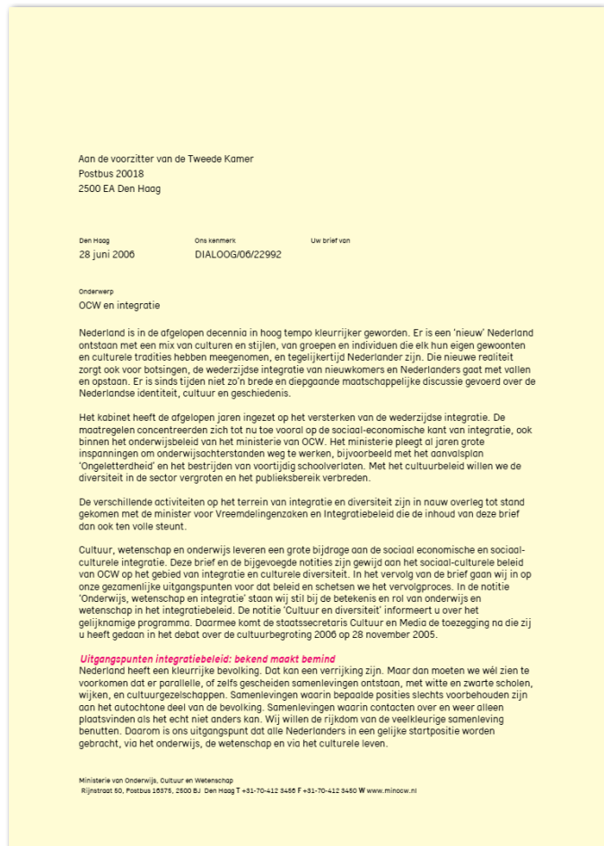
Laan, M. van der (2006) Cultuur en diversiteit

Van der Laan beschrijft in 2003 in haar Uitgangspuntenbrief Cultuurplan 2005-2008 en Meer dan de som: beleidsbrief cultuur 2004-2007 het belang van culturele diversiteit. Ze hield vast aan de drie doelstellingen uit de periode 2001-2004: meer diversiteit in het aanbod, in het publiek en in de samenstelling van besturen en personeel. Centraal stond ‘interculturele programmering’ waarmee zij de samenwerking tussen reguliere en multiculturele circuits wilde bevorderen. 23 Dat is noodzakelijk, schrijft ze een jaar later in de Cultuurnota 2005-2008: meer