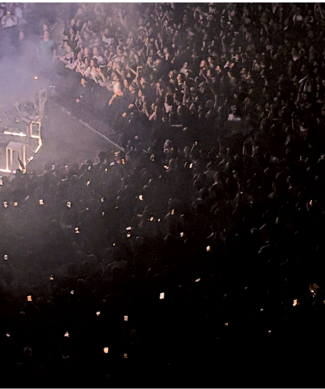
Oplichtende telefoonschermen bij een concert van Rosalía, Ziggo Dome, Amsterdam, april 2026.

dán het dichtst bij je persoonlijke ervaring wil zijn. Dat ik dat bij Dua Lipa in de Ziggo Dome meemaak verbaast me nauwelijks, maar ook bij het Concertgebouworkest kwamen bij het slotkoor van de Gurrelieder de telefoons uit de handtasjes en broekzakken.