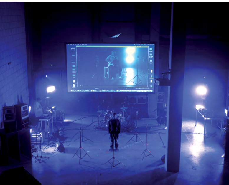
Tutto Questo Sentire tijdens AM.PM.AM. #1 met Tutto Questo Sentire, Nest in Laak, Den Haag, 2025.

D e nacht kent veel cultuuruitingen die zweven tussen verschillende kunst-disciplines. Kijk naar de interdisciplinaire weekender AM.PM.AM. , geïnitieerd door curator Orpheu de Jong in Nest, TRANCE van Hartwig Art Foundation, Tianzhuo Chen (Asian Dope Boys), Sonic Acts en The Infinite Now van Berlin Atonal en Unsound. Hybride kent vele vormen.