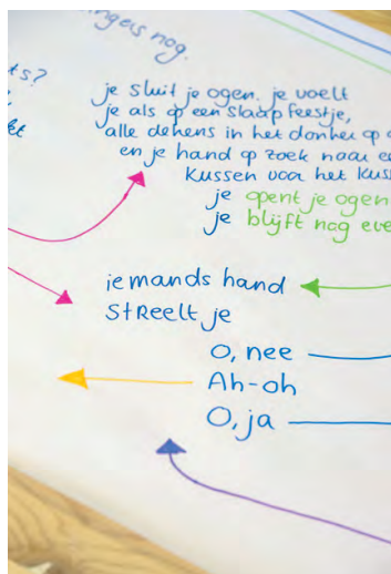
Lab voor Hybride Kunstkritiek tijdens Festival Beyond the Black Box, De Brakke Grond, Amsterdam, 12 t/m 15 februari 2026.

Voor een podiumkunstenfestival met de naam Beyond the Black Box is het opvallend dat vrijwel alle voorstellingen zich binnen de muren van het theater afspelen, merkt een van de deelnemers op. Het is dag twee van het Lab voor Hybride Kunstkritiek. Een groep van elf deelnemers vormt samen de 'hybride kunstredactie'.