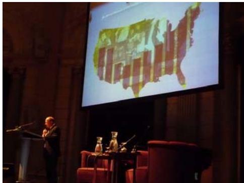
Randy Cohen tijdens het middagedeelte

om meer zicht op de ontwikkelingen in de kunstensector te krijgen en die te gebruiken om het belang van de sector te onderbouwen. 'Measure your treasures' , zo vatte Cohen het belang van de index samen.