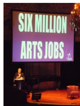
Zoek gedeelde belangen