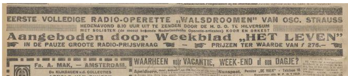
Afbeelding 2: advertentie eerste volledige radio-operette, Handelsblad , 23 mei 1925.

Ik wil weten of en wanneer meer radio operettes zijn uitgevoerd in samenwerking met Het Leven. “Radio operette” levert teveel treffers op, dat wordt zoeken naar een speld in de hooiberg. De radio heeft immers met name voor de Tweede Wereldoorlog duizenden operettes uitgezonden ook van buitenlandse zenders. “Radio-operette” met een liggend streepje brengt me meer gerichte treffers, waaruit ik opmaak dat er mogelijk sprake is van een eigen genre van speciaal voor de radio gecomponeerde operettes. Ik sorteer de treffers op datum en zie dat de eerste uitzending van een volledige radio-operette in samenwerking met Het Leven heeft plaats gevonden op 23 mei 1925. Het was de operette Walsdromen van Oscar Straus. (Zie afbeelding 2).