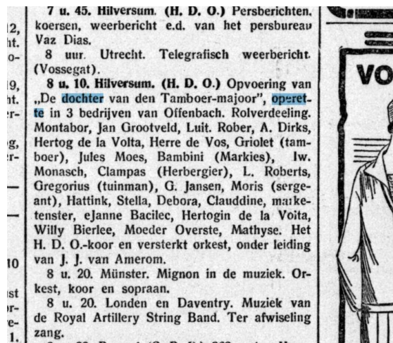
Afbeelding 1: Gooi en Eemlander , 19 maart 1926, dageditie.

daar vermeld dat de algemene voorbereiding door Chris de Vos was gedaan en het stuk werd aangeboden door “Het Leven.” Hier ligt dus een link met de naam van Chris de Vos bovenaan de partituur. In de Gooi en Eemlander van 19 maart tref ik vervolgens een aankondiging met een overzicht van de cast. (Zie afbeelding 1).